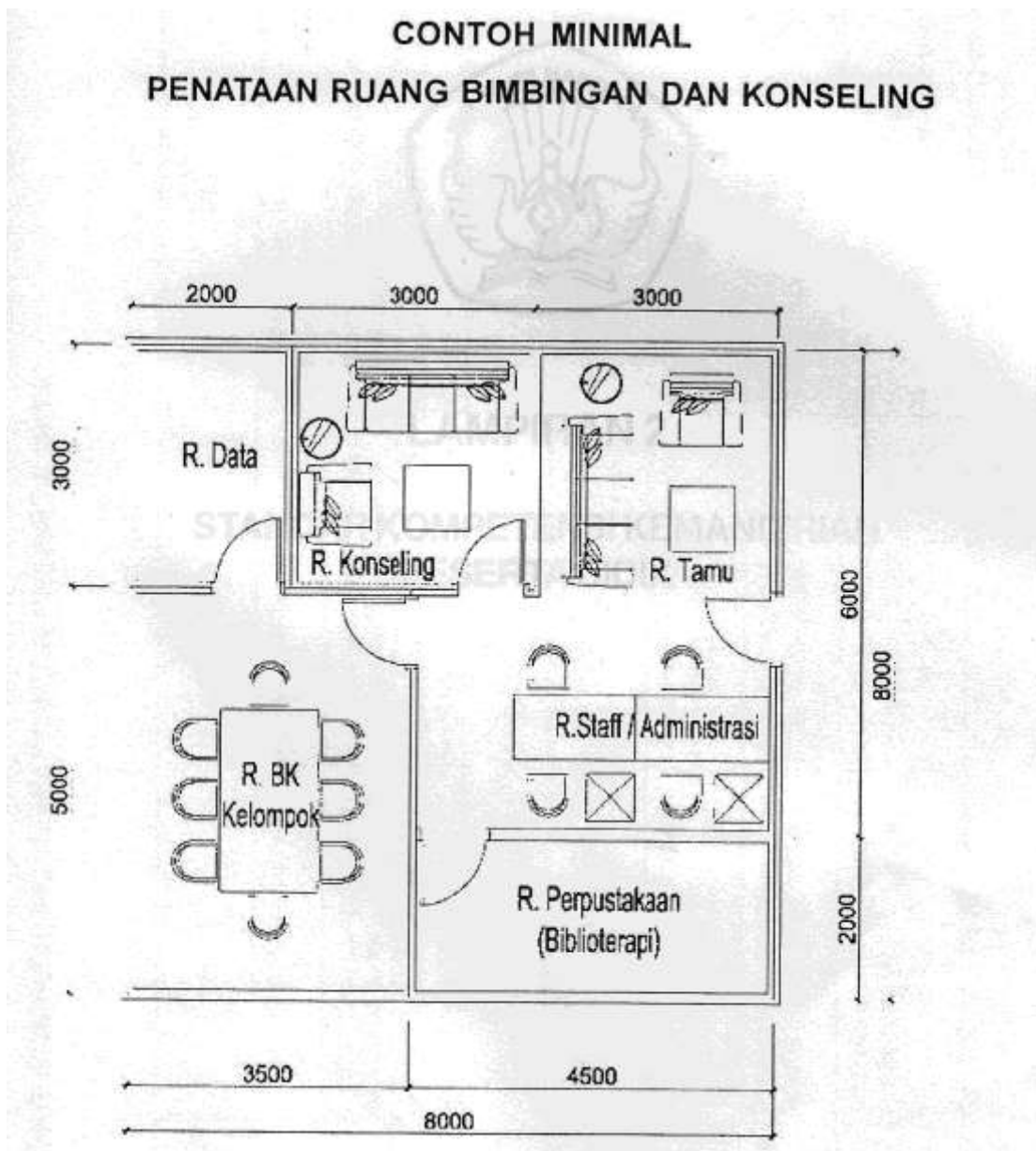
Gambar 6.1 Penataan Ruang Bimbingan dan Konseling

Dengan kata lain, mengelola sarana perlu memperhatikan ketepatan, mudah dicapai/diupayakan, individualitas dan ruang pendukung untuk mengatur mekanisme layanan BK. Di samping itu, juga termasuk fasilitas pendukungnya: alat pengumpul data, alat penyimpan data, perlengkapan teknis, dan perlengkapan administratif. Berikut diberikan contoh penataan ruang BK (Gambar 6.1, 6.2, dan 6.3).